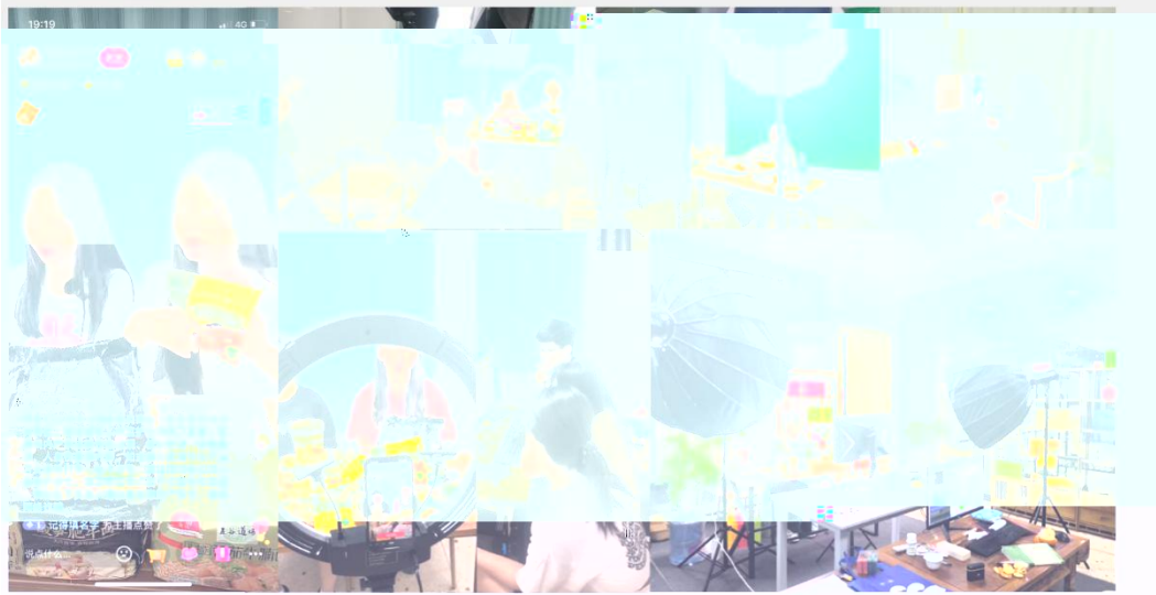
部份学员在进行电商直播实训现场